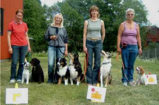
Träningsgänget från Heby brukshundklubb.

Publiken fick även prova på själva att gå runt banan med sina fyrfota vänner.