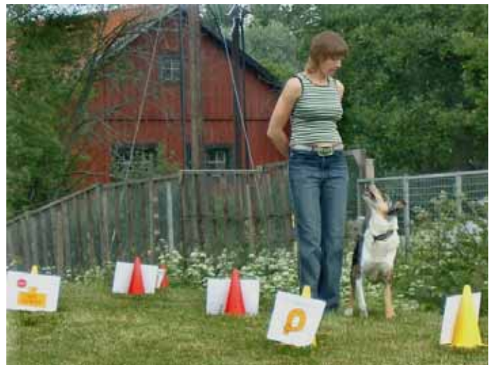
Carolina och Pripps i full koncentration.

Man får som förare hela tiden prata och uppmuntra sin hund under hela banan och momenten.