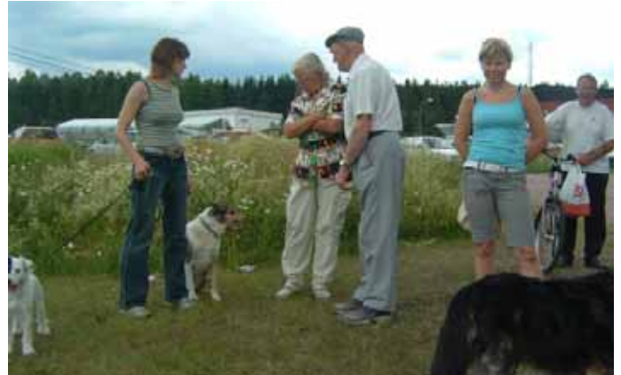
Många ville få en förklaring av denna nya märkliga hundaktivitet.

Skyltarna placeras till höger om förarens väg utom de som anger byte av färdriktning. De ska placeras mitt framför föraren.