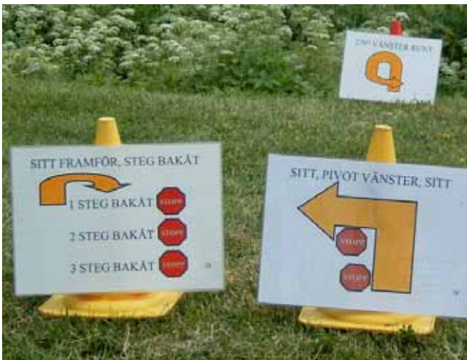
Skyltarna kan ibland se ganska kluriga ut.

Med tre till fem meter mellan skyltarna och även uppställda koner på banan så såg det hela ut att bli en väldigt fartfylld lydnads-gren. Och med ett namn som Rallylydnad trodde jag att det ska gå fort och på tid men där hade jag fel.